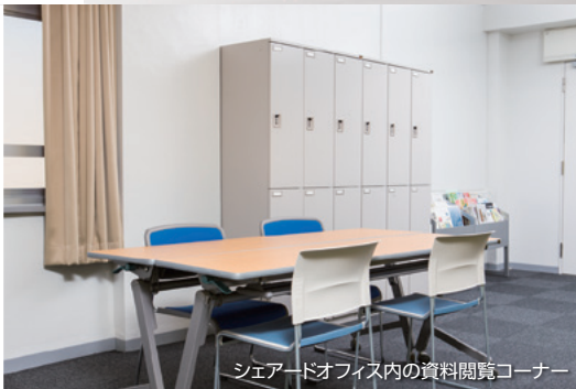
シェアードオフィス内の資料閲覧コーナー