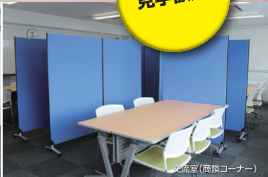
交流室(商談コーナー)