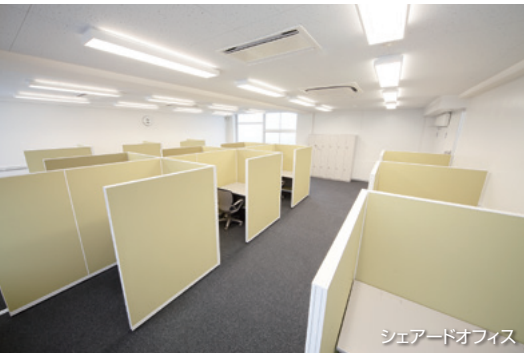
シェアードオフィス